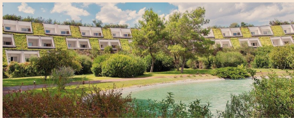
Hotel cinque stelle. Una veduta del Kalidria a Castellaneta Marina (Taranto). Il complesso turistico si estende su un'area di 78 ettari